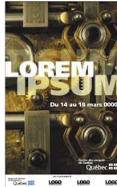
Exemple du point 6

Il importe de chercher à obtenir la meilleure visibilité et de privilégier le coin inférieur droit comme emplacement.