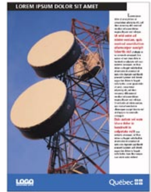
Exemple du point 7